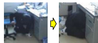
机の下にもぐり、 ダンゴ虫のポーズをとる。

いつ大地震が来るか分かりません。しかし日頃から「どこへどのように避難するか」を意識 することが、生死を分ける場合があると専門家は言います。ぜひ心しておきましょう。