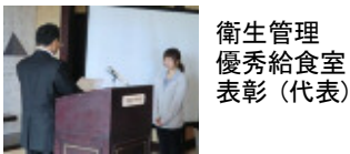
衛生管理 優秀給食室 表彰(代表)

続いて衛生管理優秀給食室の表彰、本部上長、各店長及び業務責任者、エリア責任者等から、前年度報告と今年度の目標が発表されました。