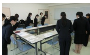
ビジネスマナー(あいさつ)