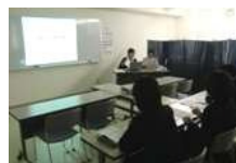
スライドを見ながら 衛生講習