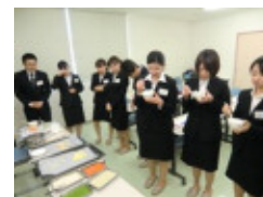
食事形態について