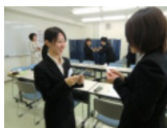
ビジネスマナー(名刺交換)