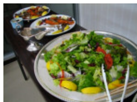
← バイキング料理の一部 →